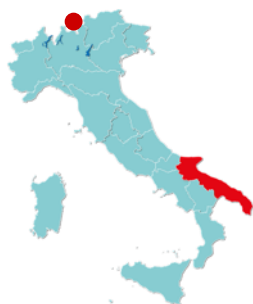
Região da Puglia