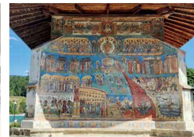
MONASTÉRIO DE VORONET