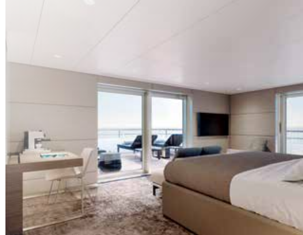
Varandas privadas na maior parte das acomodações