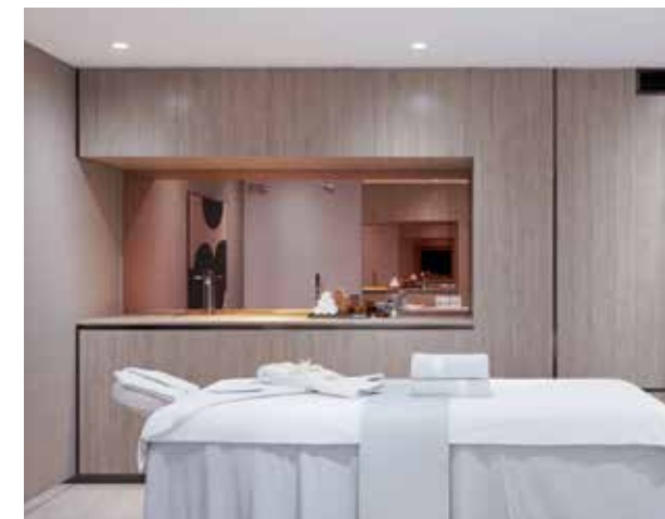
Spa e Sauna infravermelha