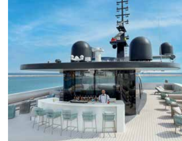
Deck externo com bar