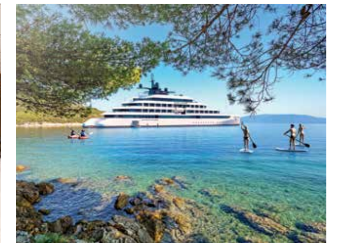
Plataforma náutica para banho de mar/esportes aquáticos e visitas em terra com guias locais