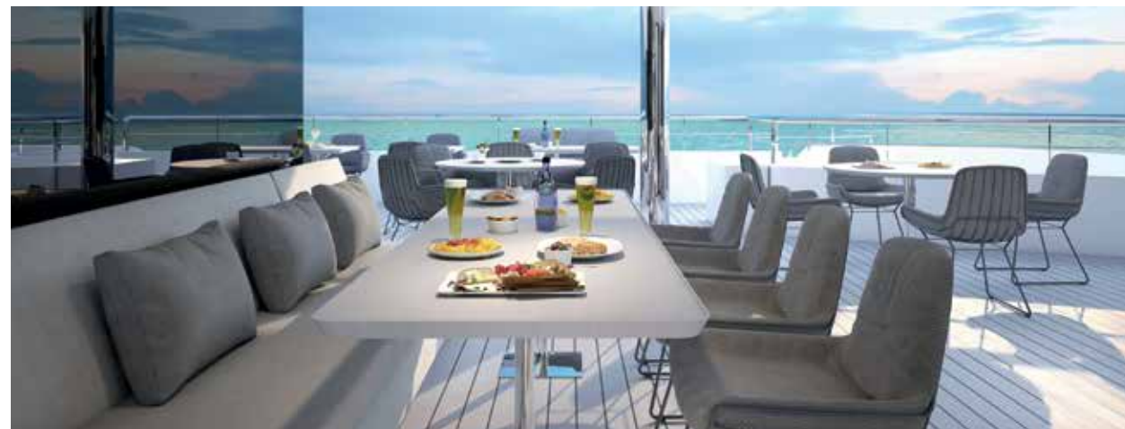
Restaurante principal e opção de refeições ao ar livre