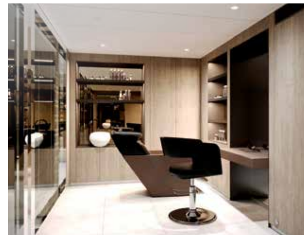
Salão de beleza, lavanderia e outras comodidades * Serviços sob demanda e pagos à parte