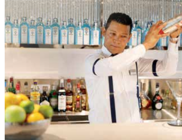
Bares e lounges panorâmicos