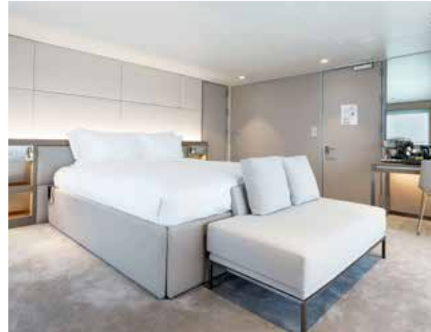
50 suítes e cabines distribuídas em 6 categorias