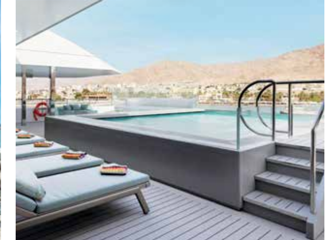
Piscina e jacuzzi