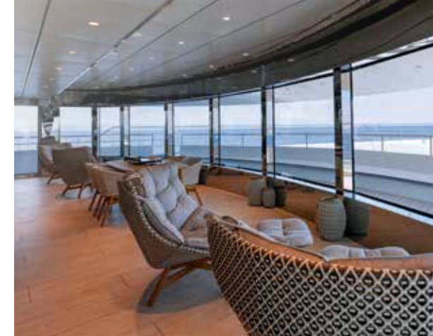
Diversas áreas de convivência